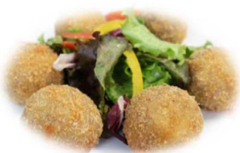
手作り牛肉コロッケ