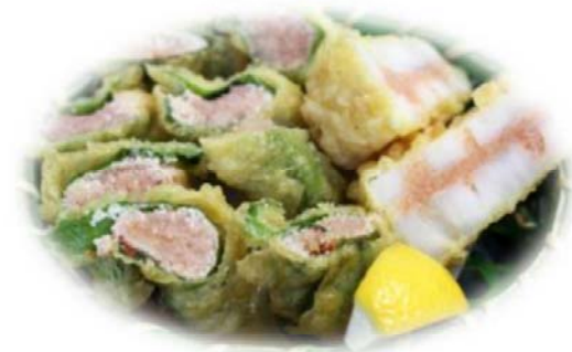
博多明太子天婦羅